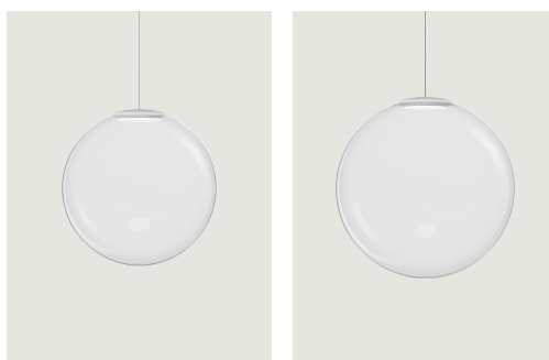
Non Random 33